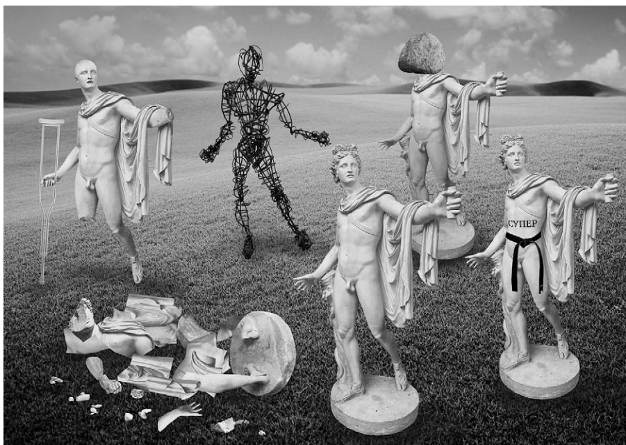
Рис. 1. Homo oeconomicus и K o

но и альтруистически. (На рис. 1 он представлен в виде скульптуры Аполлона с черным поясом и татуировкой «СУПЕР».) Единственное требование к его поведению — оно должно оставаться рациональным (иными словами, последовательным и внутренне непротиворечивым). Своим рождением Супер-Аполлон обязан упоминавшемуся ранее «экономическому империализму», выступившему с претензией на унифицированное объяснение любых возможных форм человеческого поведения исходя из расширенной модели рационального выбора.