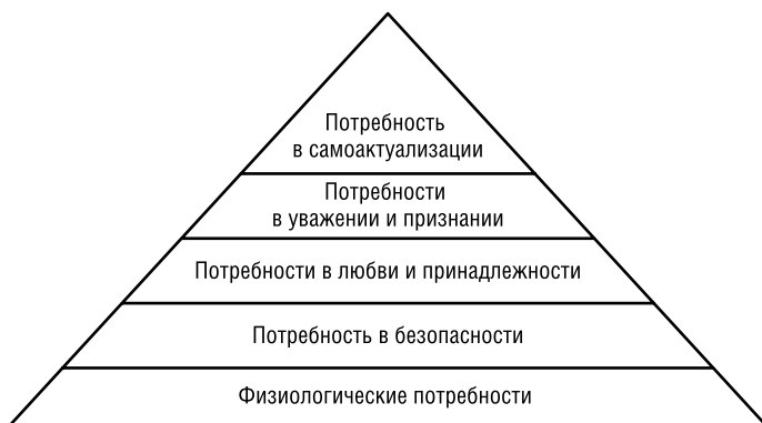
Рис. 4. Пирамида потребностей Маслоу

дополнительный доход человек Маслоу будет направлять на удовлетворение потребностей более низкого порядка, оставшихся до сих пор еще не до конца удовлетворенными [Meckling, 1976].